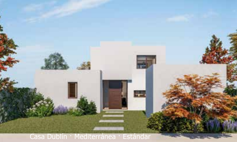
Casa Dublín · Mediterránea · Estándar