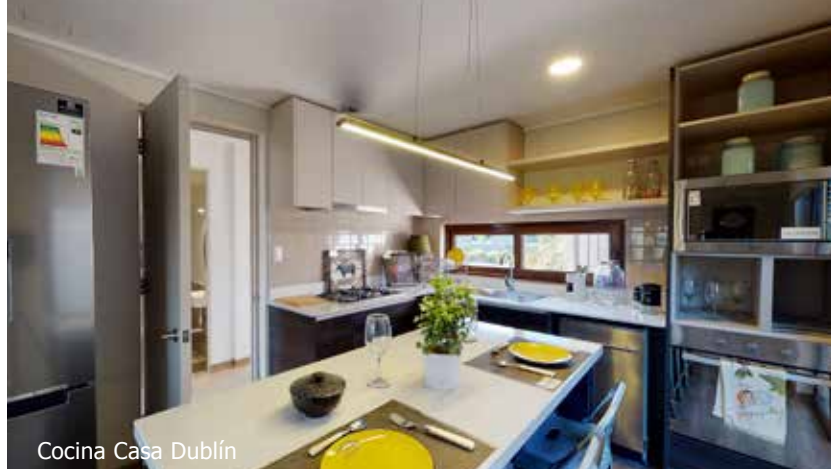
Cocina Casa Dublín