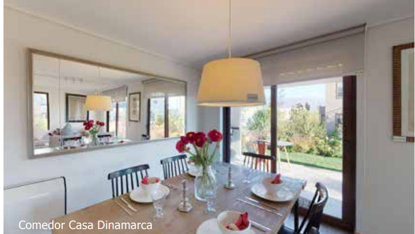
Comedor Casa Dinamarca