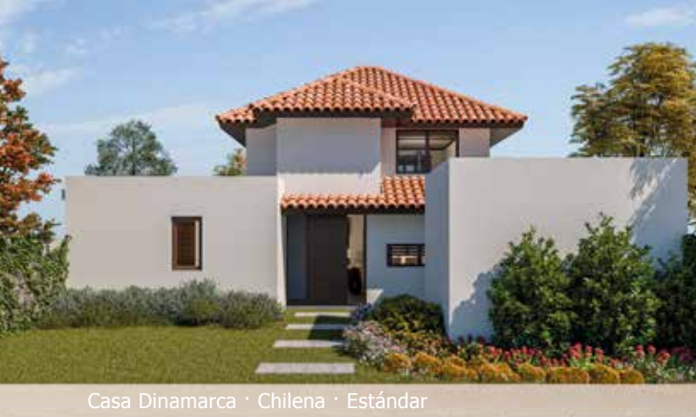
Casa Dinamarca · Chilena · Estándar