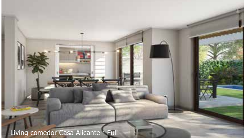
Living comedor Casa Alicante · Full