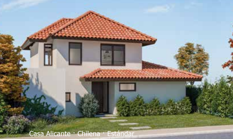
Casa Alicante · Chilena · Estándar