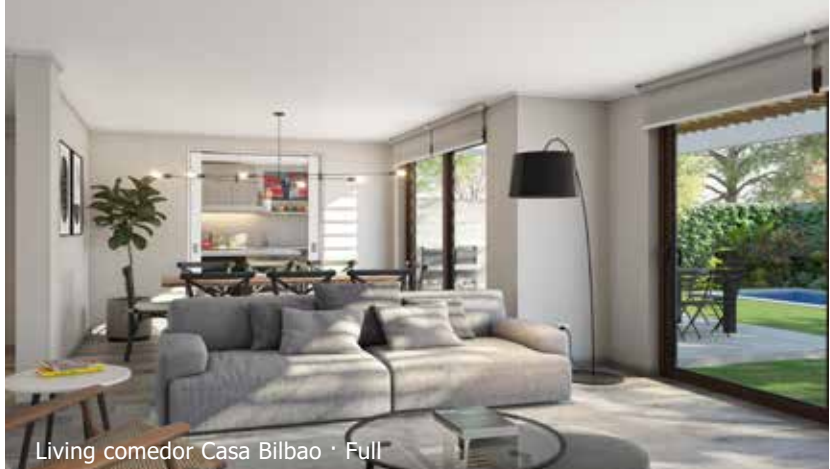
Living comedor Casa Bilbao · Full