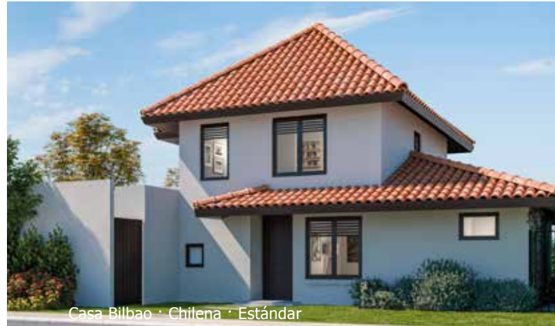
Casa Bilbao · Chilena · Estándar