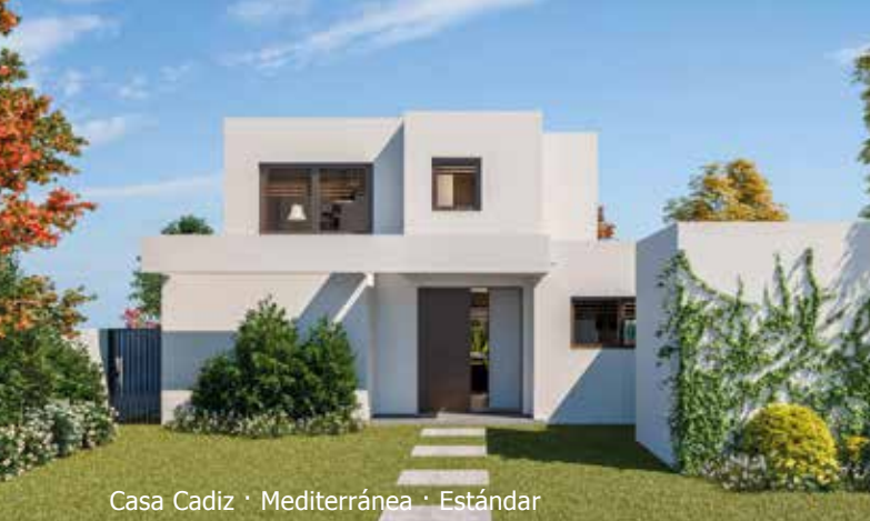
Casa Cadiz · Mediterránea · Estándar