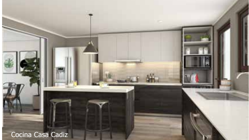
Cocina Casa Cadiz