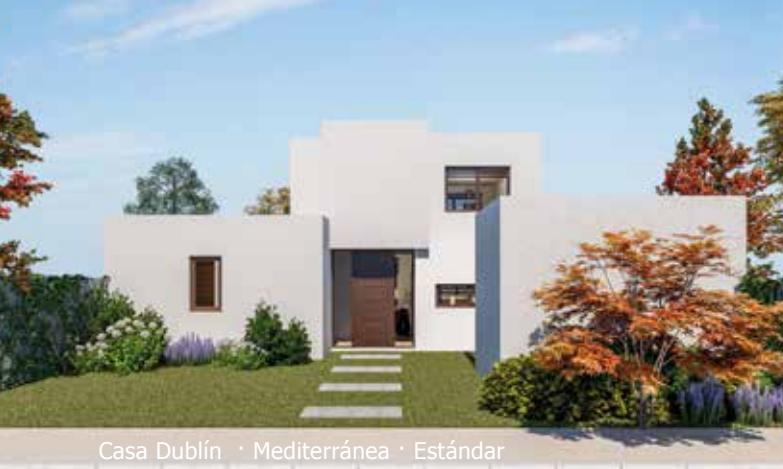
Casa Dublín · Mediterránea · Estándar