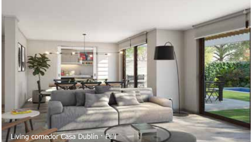
Living comedor Casa Dublín · Full