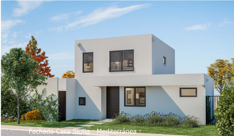
Fachada Casa Sicilia · Mediterránea ·