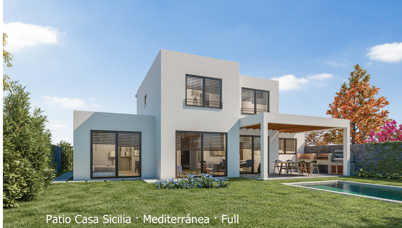
Patio Casa Sicilia · Mediterránea · Full