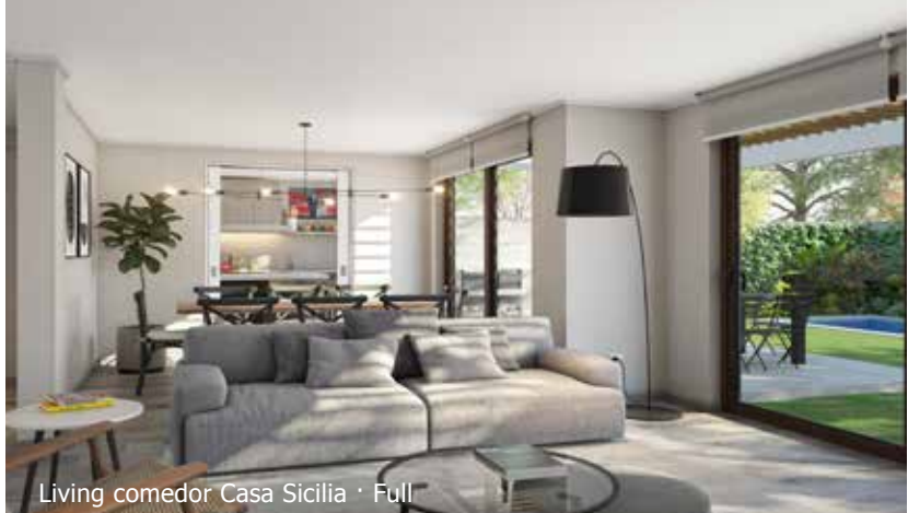
Living comedor Casa Sicilia · Full