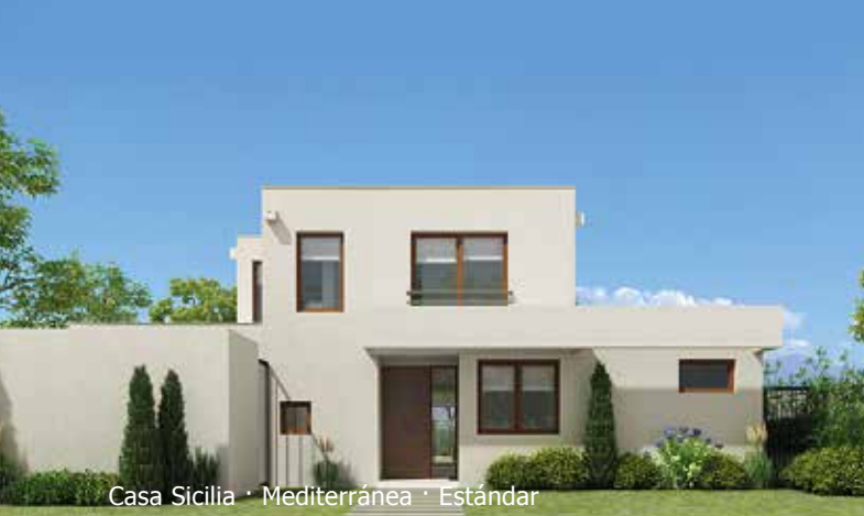
Casa Sicilia · Mediterránea · Estándar