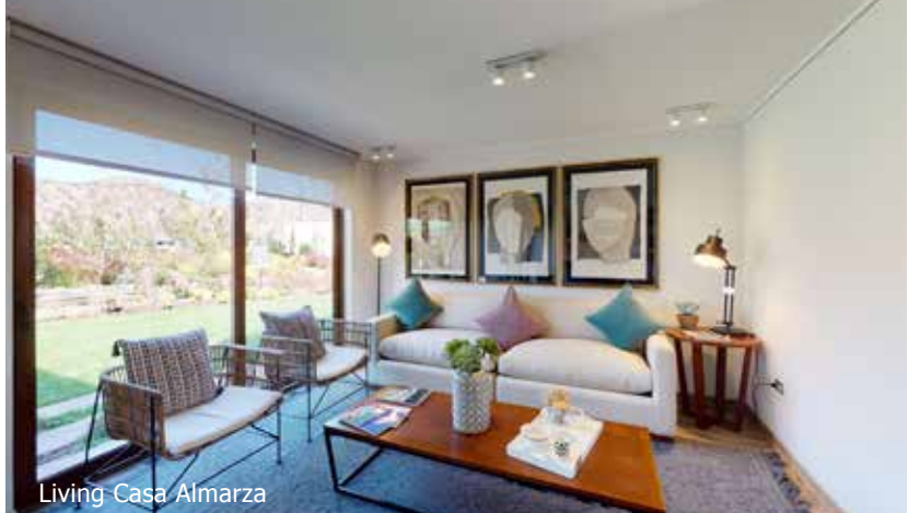
Living Casa Almarza