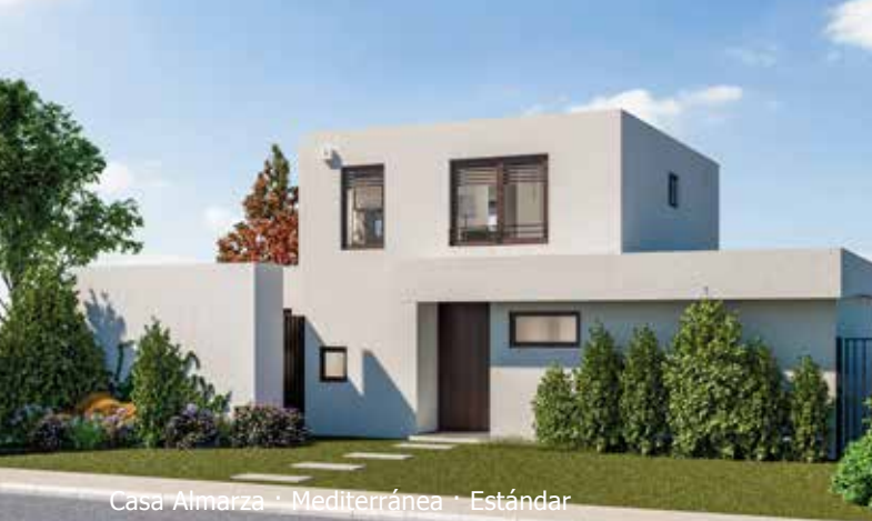
Casa Almarza · Mediterránea · Estándar