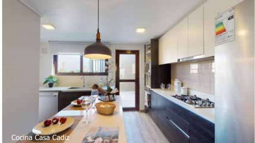
Cocina Casa Cadiz