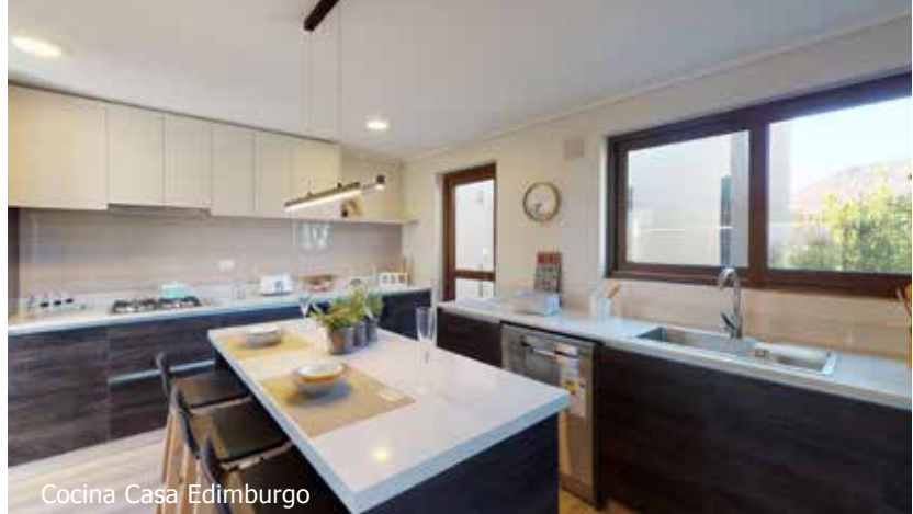
Cocina Casa Edimburgo