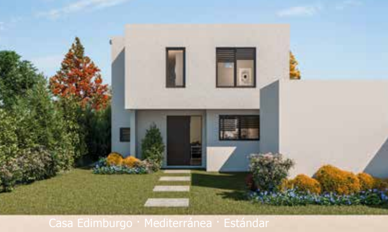
Casa Edimburgo · Mediterránea · Estándar