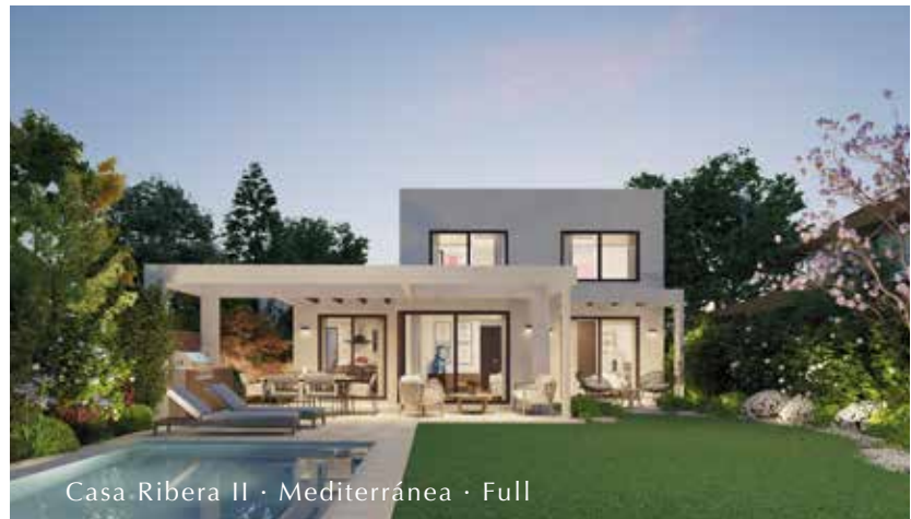
Casa Ribera II · Mediterránea · Full