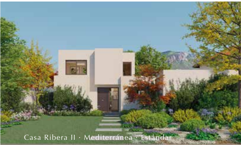
Casa Ribera II · Mediterránea · Estándar