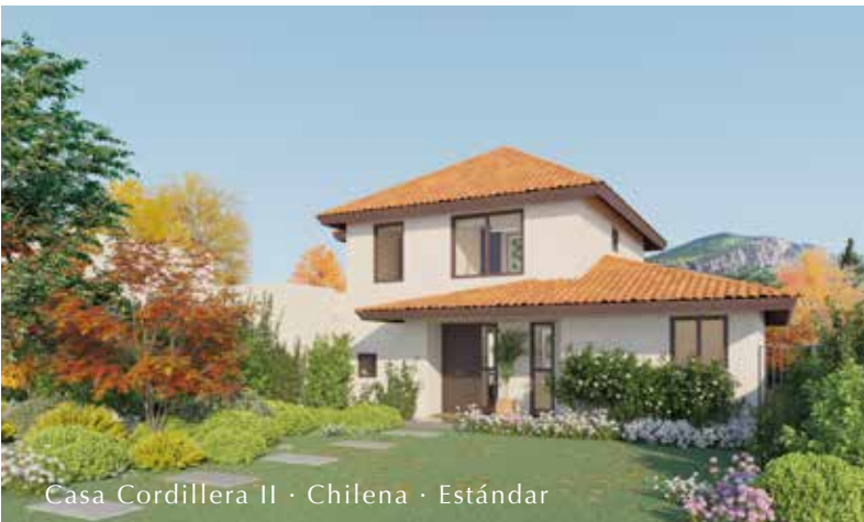
Casa Cordillera II · Chilena · Estándar