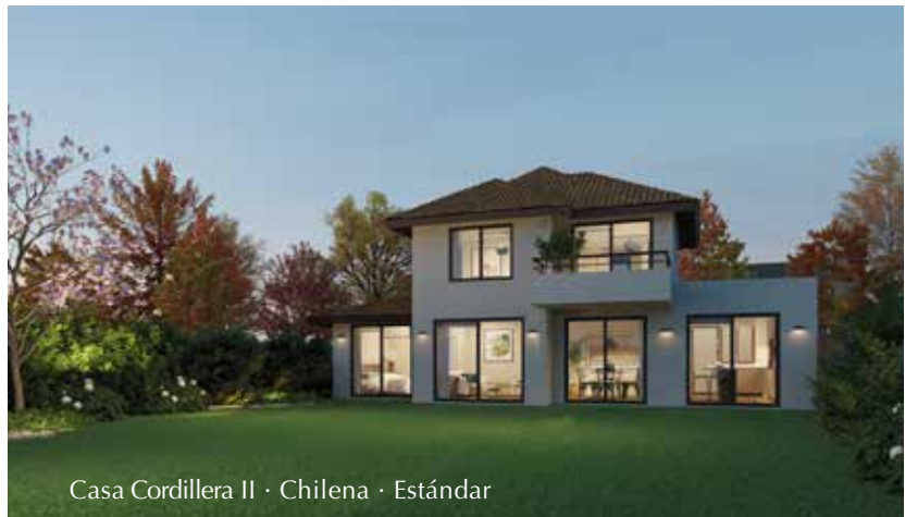
Casa Cordillera II · Chilena · Estándar