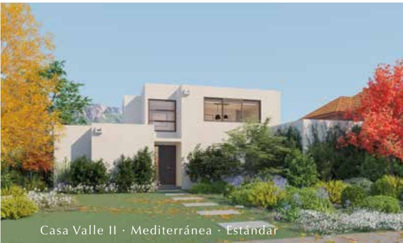
Casa Valle II · Mediterránea · Estándar