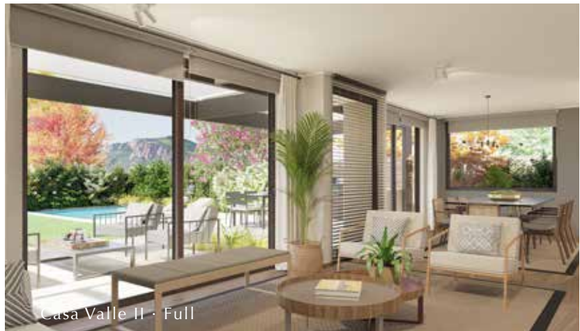
Casa Valle II · Full