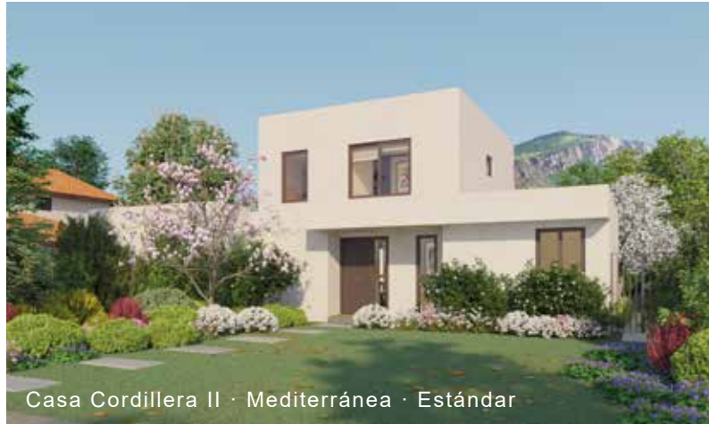
Casa Cordillera II · Mediterránea · Estándar