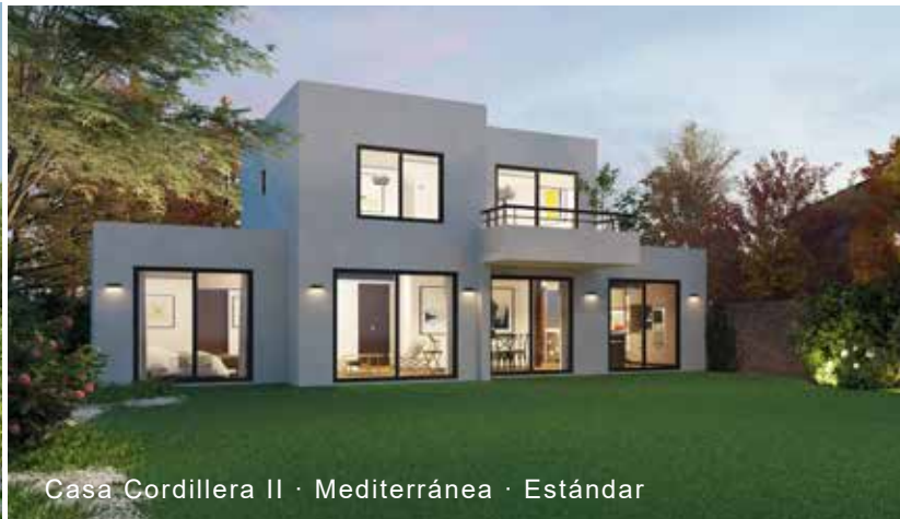
Casa Cordillera II · Mediterránea · Estándar