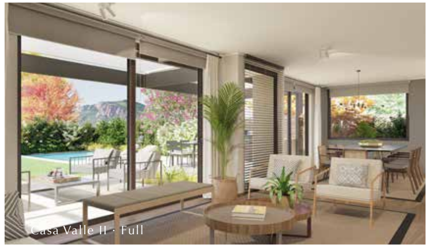
Casa Valle II · Full