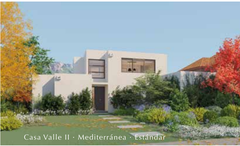
Casa Valle II · Mediterránea · Estándar